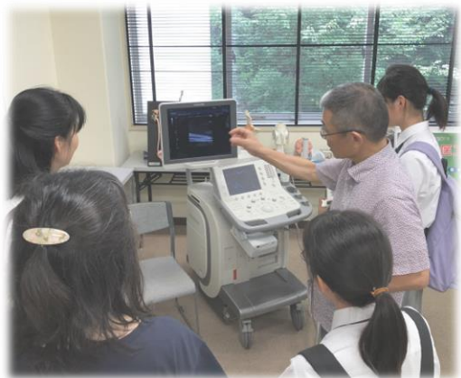
超音波診断装置でクイズに挑戦!

学科教員や大学生が、学科の3つのコースについて詳しく教えてください。例年大好評の3つのコースに関連する実験や、機器操作コーナーもあるよ。他にはない学科の魅力、特色を体験してみてください!! (イベント内容は変わる可能性がありますのでご了承ください)