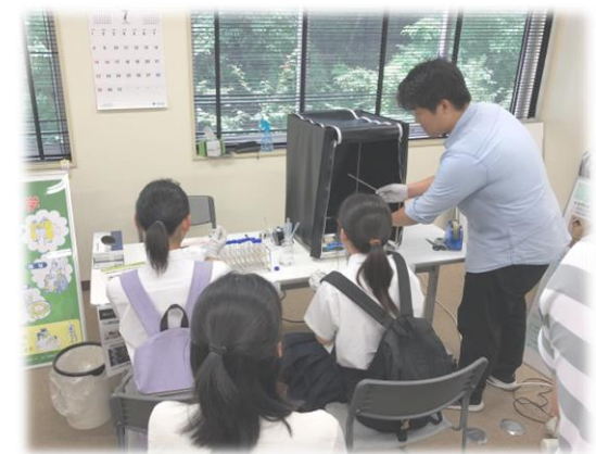
DNA抽出実験、きれいに光るよ!