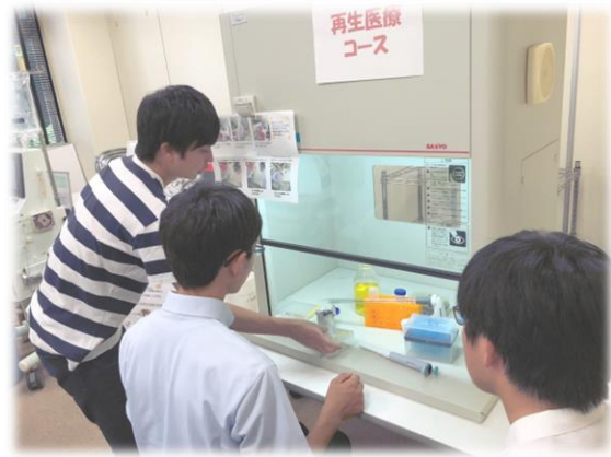
細胞培養のテクニックを学ぼう!